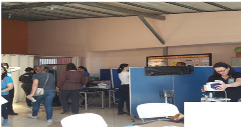
Programa Becas Municipales