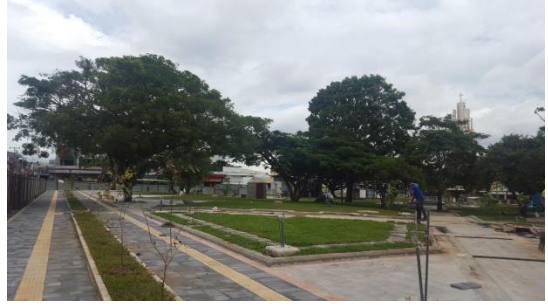
Imagen #4 y #5 Zona verde, costado norte del Parque de Los Ángeles