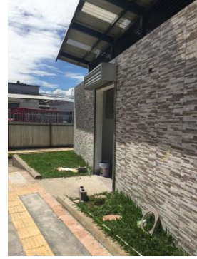
Imagen #26 y #27 Servicios Sanitarios y área para ferias