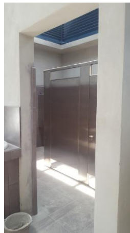
Imagen #28 y #29 Servicios Sanitarios