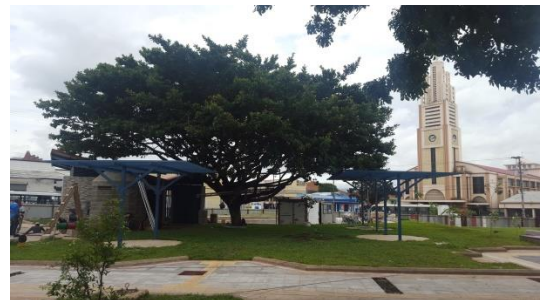
Imagen #22 y #23 Pergolados, zonas de picnic