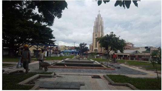
Imagen #12 y #13 Aceras internas, parque Los Ángeles