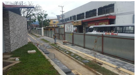
Imagen #8 y #9 Costado este, parque Los Ángeles