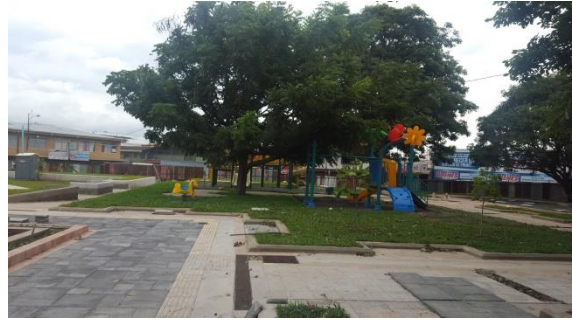
Imagen #18 y #19 Área juegos infantiles

Esta sección está pendiente solamente la instalación del zacate sintético en la zona donde están los juegos infantiles.