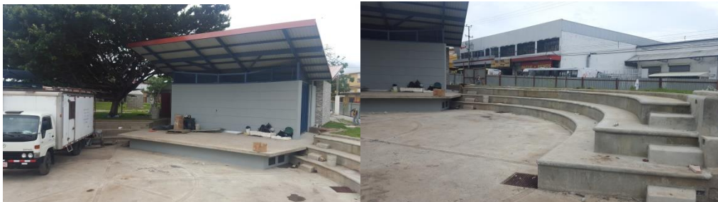
Imagen #30 y #31 Anfiteatro

Es importante aclarar que el plazo de entrega original se amplió 70 días, este mediante Acuerdo del Concejo SCM-732-2016 y el mismo se justifica en lo siguiente: