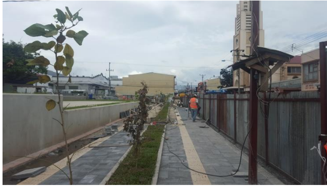
Imagen #7 Costado sur, parque Los Ángeles