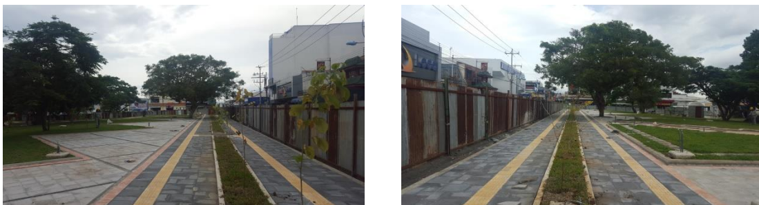
Imagen #2y #3 Costado norte de Parque de Los Angeles, acera perimetral

A nivel de obra civil el parque se encuentra completamente construido, entiéndase obra civil todo lo relacionado a las cunetas, cordones de caño, evacuación pluvial (tubería pluvial), instalaciones electromecánicas (tubería agua negras, potable y eléctrica), aceras, zonas verdes, espejo de agua, sistema de riego, anfiteatro, entre otras.