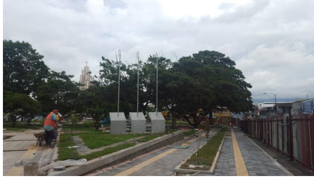
Imagen #6 Costado oeste, parque Los Ángeles