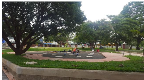
Imagen #16 y #17 Área mini-gimnasios

Esta sección está pendiente solamente la instalación del zacate sintético en la zona donde están los pedestales para los mini-gimnasios.