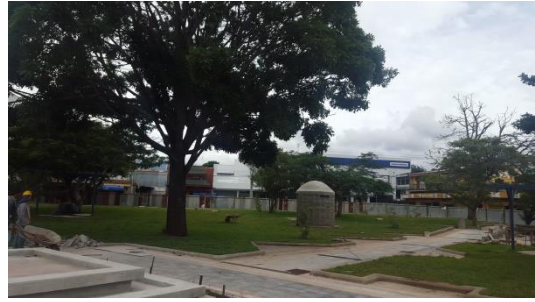
Imagen #10 y #11 Aceras internas, parque Los Ángeles