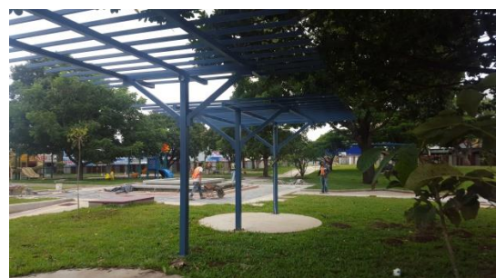
Imagen #24 y #25