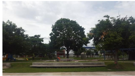
Imagen #20 y #21 Área cancha multiuso

Esta sección está pendiente solamente la demarcación de la cancha, instalación de los tableros y la malla, aspectos contratados y pagados que se instalarán al final para no dañarlos.