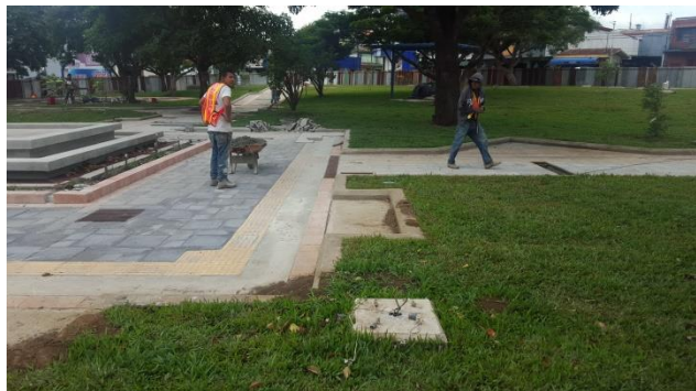
Imagen #14 y #15 Acera perimetral espejo de agua, parque Los Ángeles

En esta sección lo que está pendiente es la instalación de las bancas contratadas, algunas secciones de aceras que no tienen adoquín y que actualmente están trabajando en la pega del adoquín o loseta, tal y como se puede observar en la imagen #7 y #9 específicamente. Además de la instalación de las luminarias, ya que tanto la canalización (tubería como el cableado) está listo, tal y como se puede observar en la #15, donde está la base de la columna de la luminaria con el cableado.