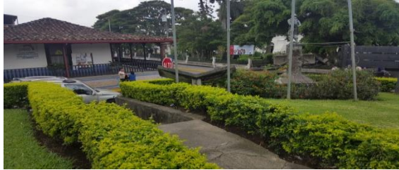
Imagen #5: Ingreso este sobre nivel superior de la antigua zona verde, acceso mediante gradas.

En la imagen # 3 y #4, se observa que la esquina contaba con un muro de contención y sobre este existía una zona verde la cual exhibía, el monumento al cruz rojista con sus respectivas placas, unas astas de bandera y en el perímetro se encontraba sembrado un seto de la especie pringo de oro.