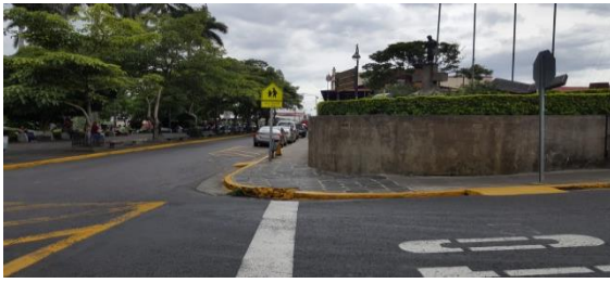
Imagen #3: Esquina sur-este

En referencia a la ubicación de las baterías sanitarias, este se respaldó técnicamente en la esquina sur este del parque del anfiteatro, para mejorar el entorno en general del parque. En las siguientes imágenes, se muestra las obras existentes y los elementos que existían en su momento, antes de la de la intervención: