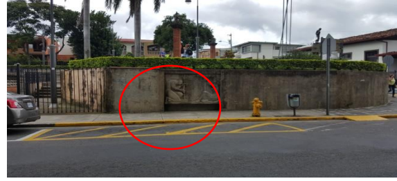
Imagen #4: Costado sur.