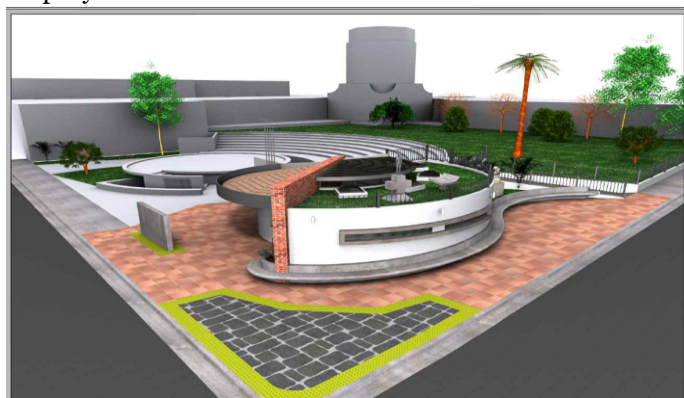
Imagen #6: Perspectiva proyecto en general.

A continuación se adjunta la perspectiva del diseño de la batería sanitaria y las obras exteriores, ver imagen #6, en donde se puede observar que se respetan las alturas promedio de la infraestructura existente (muro contención, más altura del pringo de oro y altura del anfiteatro) y se manejaron conceptos como losa verde para la cubierta y de esta manera no generar mayor altura a la batería sanitaria y conceptualizar la zona verde que existía antes del proyecto.