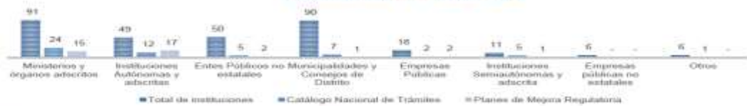
GRÁFICO N° 2 INSTITUCIONES PÚBLICAS QUE USAN EL CATÁLOGO NACIONAL DE TRÁMITES Y PLANES DE MEJORA REGULATORIA AL 31 DE MAYO DE 2019

Nota: En otros se incluye al Poder Judicial, Poder Legislativo y el Tribunal Supremo de Elecciones.