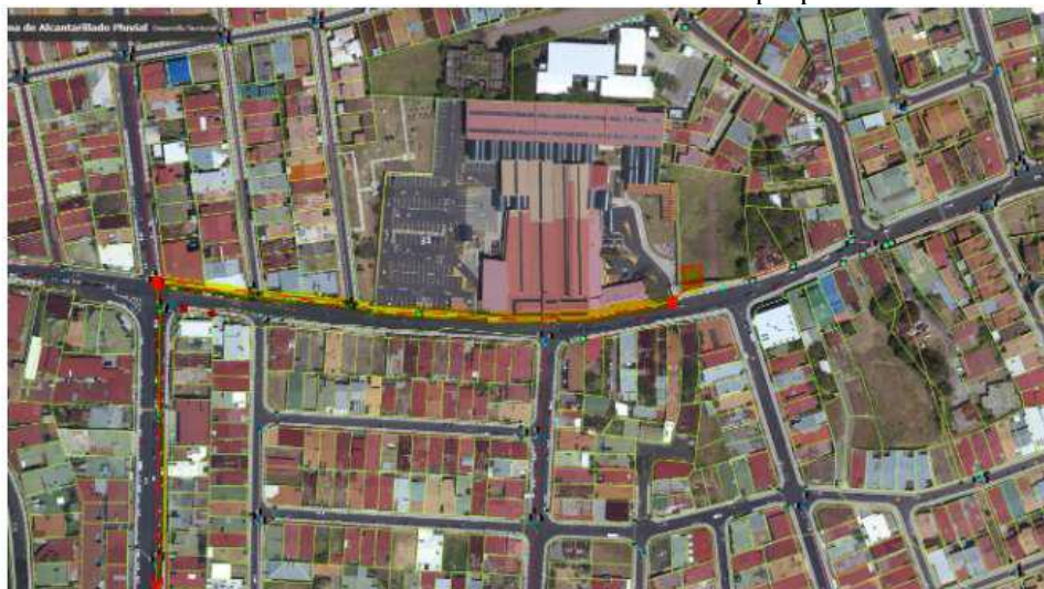
Tramo #2: Recorrido de norte a sur hasta la descarga final al Río Burío.