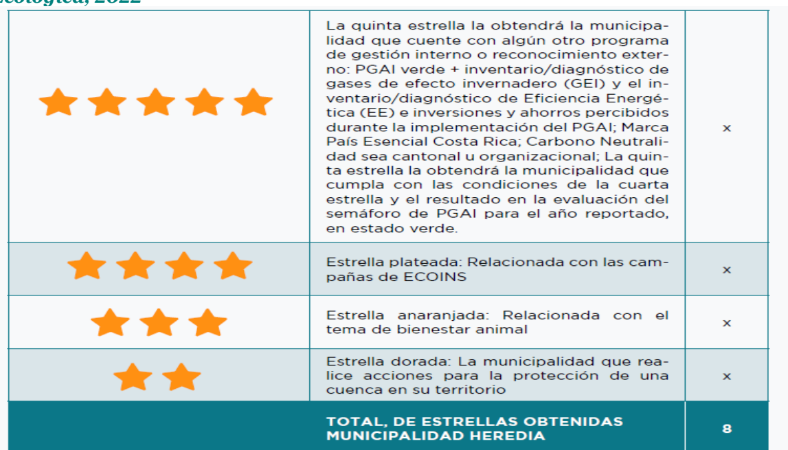
Tabla 4. Estrellas obtenidas según parámetros del Programa Bandera Azul Ecológica, 2022