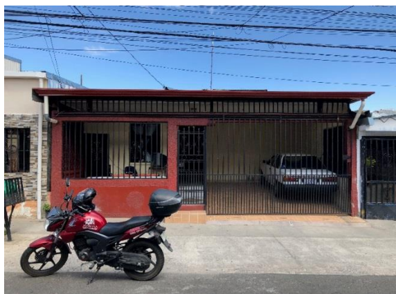
Vivienda del interesado. Casa N° 55 de Urb. IMAS de Ulloa.