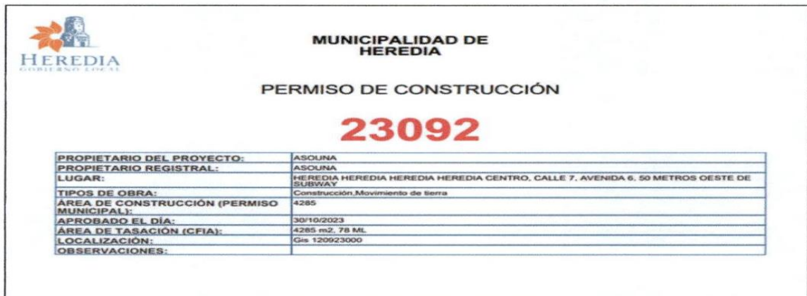
Ilustración 1 Permiso Municipal

Por este medio les saludamos y nos presentamos ante ustedes como responsables de construcción del proyecto Edificio Asouna, ubicado en la esquina entre Calle 7 y Avenida 6. El proyecto cuenta con el permiso de construcción municipal número 23092, con el número de contrato con el CFIA OC 1057658.