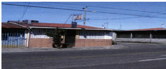
Esquina noreste Informe Auditoría 2014