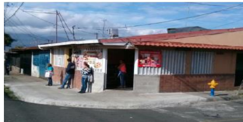
Esquina noreste según CFU 2015