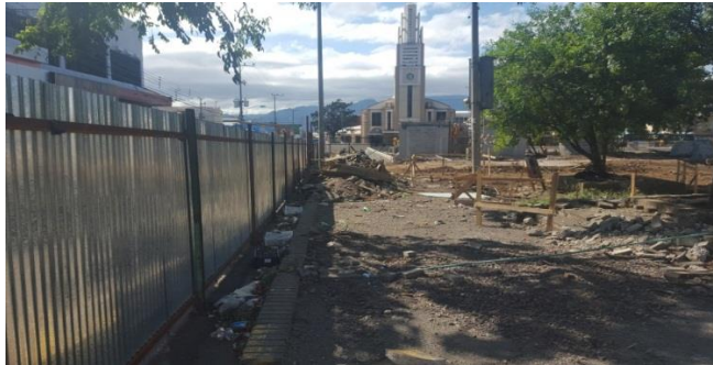
Imagen #7 Acera perimetral demolida, sección donde se iniciará con la instalación de la tubería pluvial, pendiente de demolición la sección del cordón el cual es adoquinado.