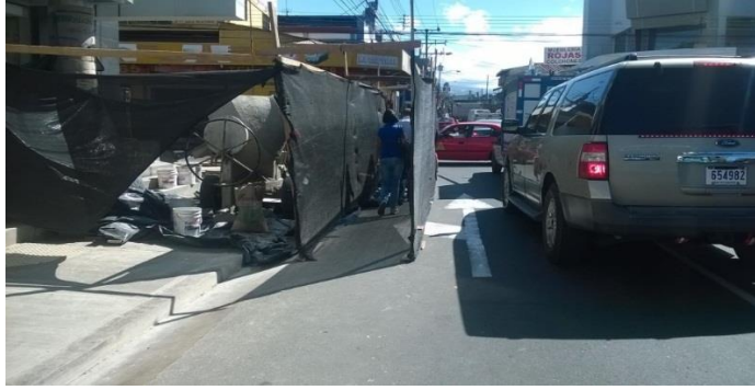
Imagen #8 Paso peatonal habilitado, Banco Nacional