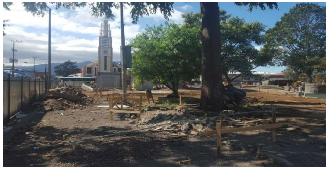
Imagen #6 Acera perimetral demolida