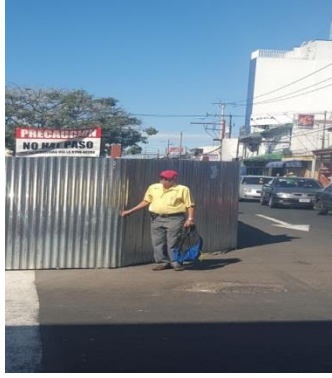
Imagen #3 Rotulo informático en la esquina del parque.