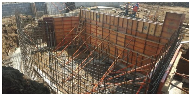
Imagen #5 Construcción anfiteatro