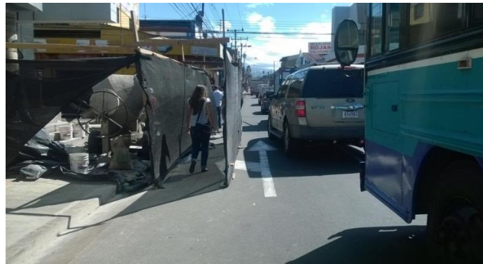
Imagen #9 Paso peatonal habilitado, Banco Nacional