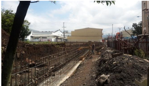
Imagen #4 Construcción muros de contención

A continuación se muestra algunas imágenes del avance constructivo, donde se evidencia el estado actual del parque.