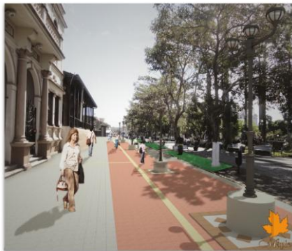
PROYECTO: BOULEVARD CIUDAD DE HEREDIA DISEÑO: CBL CONSTRUCCIONES Y ALQUILERES S.A.