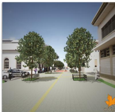
PROYECTO: BOULEVARD CIUDAD DE HEREDIA DISEÑO: CBL CONSTRUCCIONES Y ALQUILERES S.A.