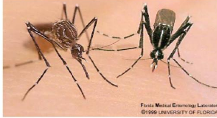
Aedes aegypti / Aedes albopictus